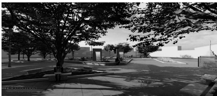
Figura 15: Projeto final.