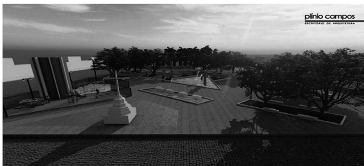
Figura 16: Projeto final.