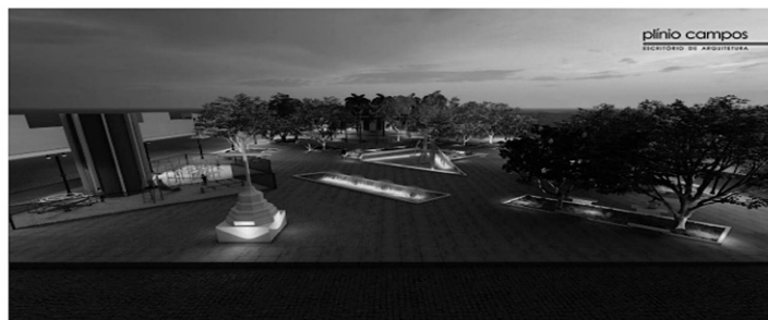
Figura 14: Projeto final.